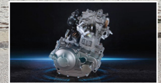
Motor de Alta Compresión