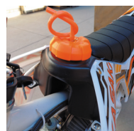
ESTANQUE 4 LITROS