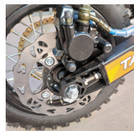
FRENOS DE DISCO