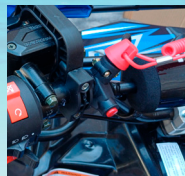
Corta corriente de seguridad