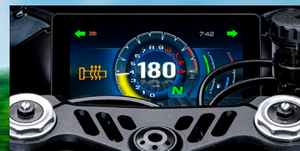
Pantalla TFT de 6,75 pulgadas