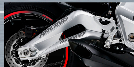
Basculante Forjado en Aluminio