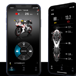
CONEXION BLUETOOTH Y SISTEMA SCREEN MIRRORING