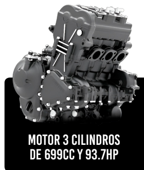
MOTOR 3 CILINDROS DE 699CC Y 93.7HP