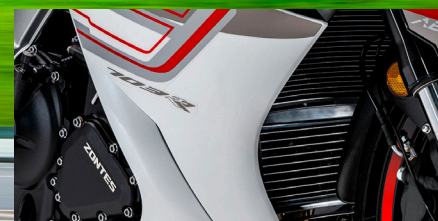
Admisión de Aire "RAM AIR"